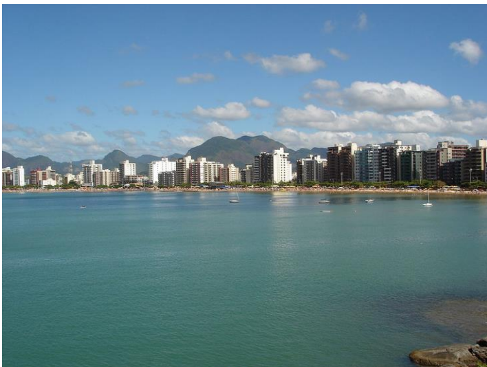
Praia do Morro, vista do mar.

Considerando o avanço do mar sobre a faixa de areia na Praia do Morro, causada pela ação das ondas oceânicas, bastante frequentada por turistas dos municípios e estados vizinhos que vem se agravando com o passar do tempo. A cada ressaca do mar, pode-se observar nitidamente a retirada da areia desta praia. Nos períodos de mal tempo – inverno e outono – há grande perda de areia devido a incidência de ondas de períodos longos e grandes alturas - as chamadas ondas Swell - que devido sua intensa energia retiram a areia da praia e as transporta para o largo, em direção offshore . Este é um processo contínuo que somente poderá ser interrompido com implantação de obras adequadas no litoral – aterro hidráulico, espigões ou quebra-mares, etc.