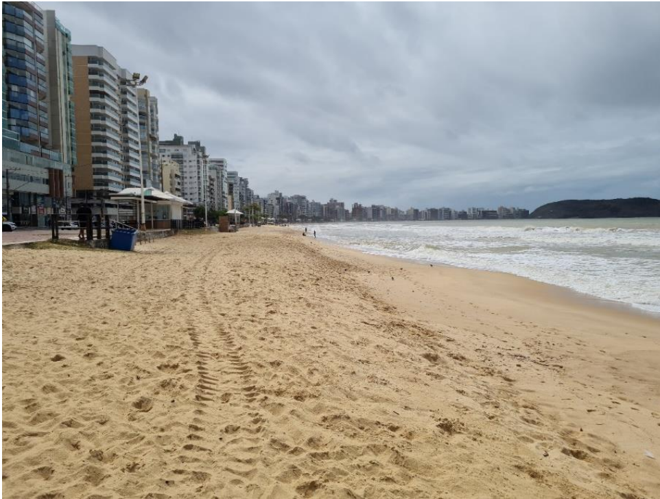
Praia do Morro – vista para o norte.