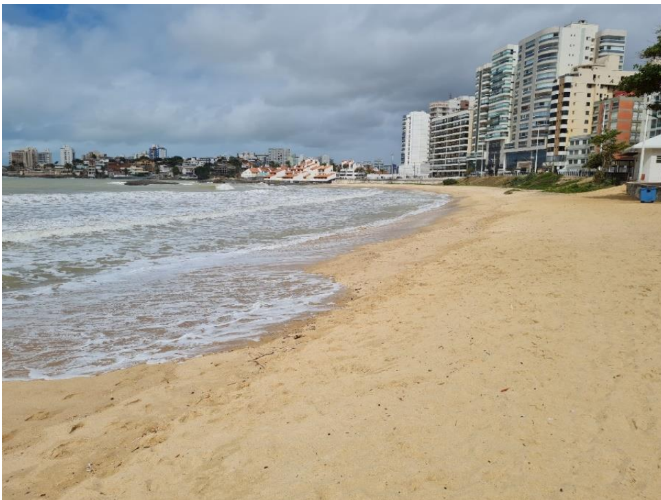
Praia do Morro – vista para o sul.