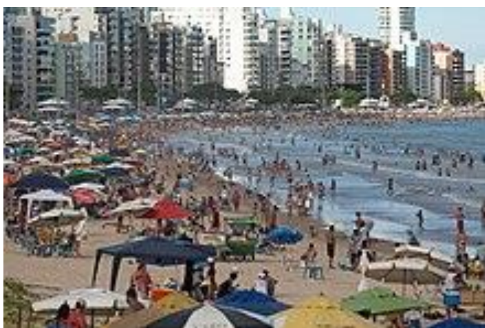
Praia do Morro durante o verão.

O “Guia 4 Rodas de Praias” informa sobre a Praia do Morro: “Movimentada, com calçadão e quadras de esportes. Em frente à Ilha da Raposa”.