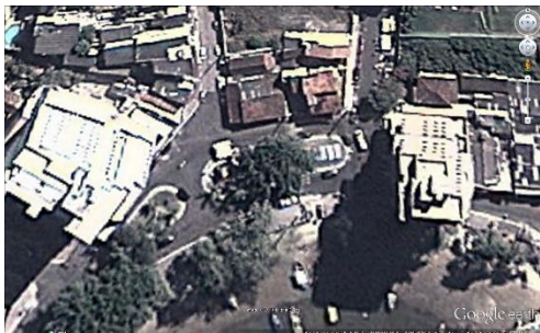
Figura 01 – Foto aérea

O presente documento tem por objetivo destacar os elementos significativos referentes ao projeto de revitalização da praça pública localizado no entroncamento da Rua Heitor Lugon no Bairro Muquiçaba, Guarapari, ES; georeferenciada pelas coordenadas 20°39'44,06"S e 40°29'48,05"O. Possui uma temperatura média em torno de 24,4º C, e vento predominante no sentido nordeste-noroeste, e ventos chuvosos no sentido Sul-Norte.